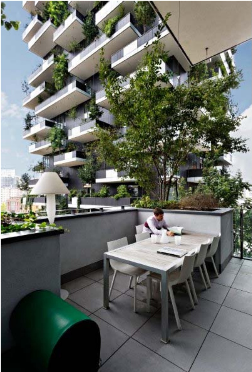
Weitere Fotos zu „bosco verticale“: