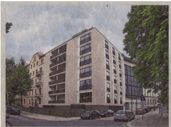
Modernes im Gründerzeitviertel: Durch die Farbe und die großen Linien passt sich das Haus an die Umgebung an.